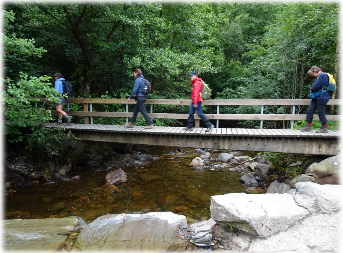
Het pad leidt ons naar een van de mooiste landschappen van de Oostkantons, het landschap dat gevormd wordt door de waterval van Bayehon.