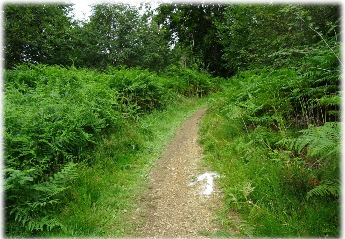
Met enkele enthousiastelingen doe ik nog een bijkomende wandeling in de vallei van de Bayehon.