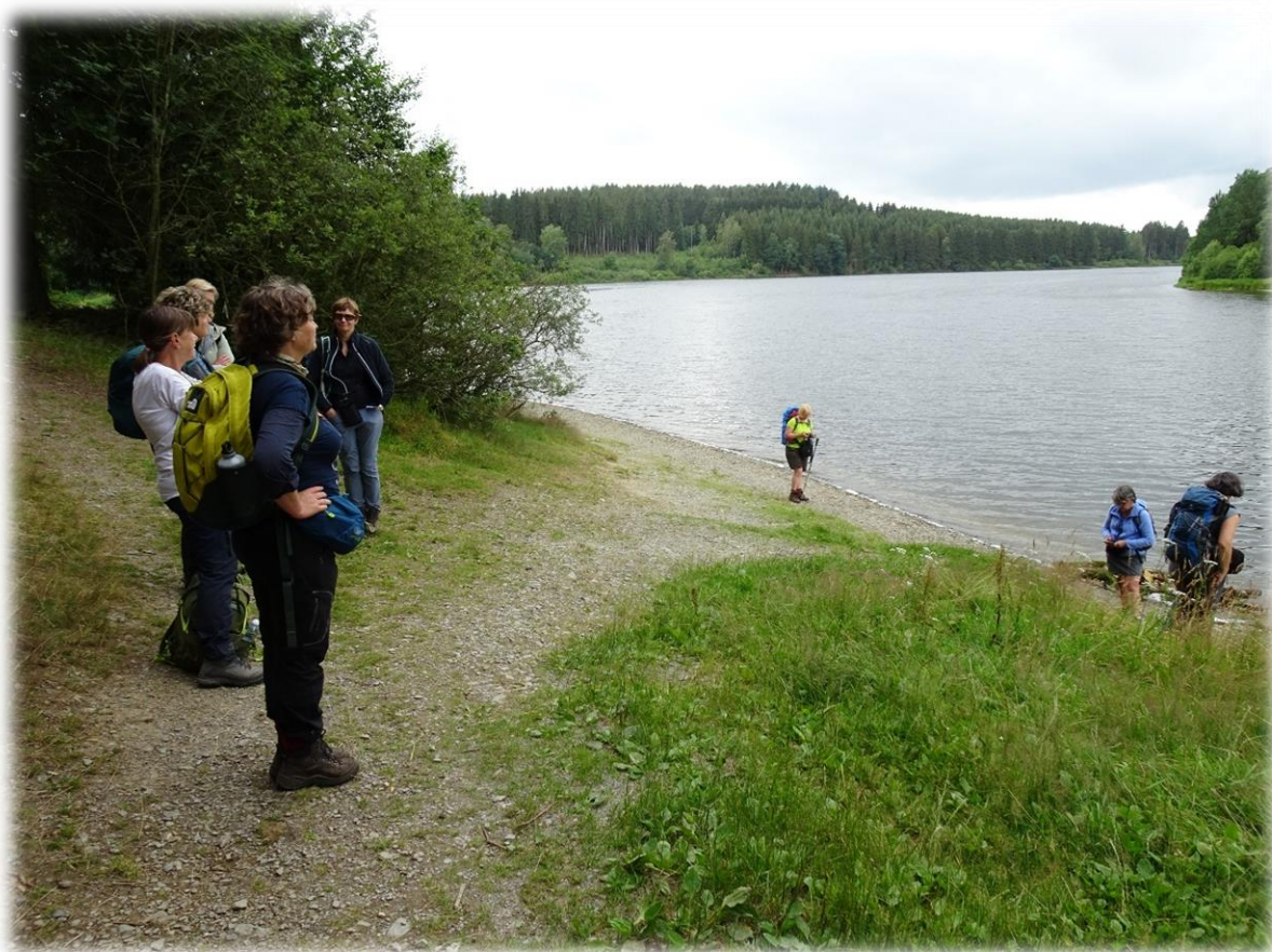
Deze wandeling komt ook even tot aan het meer van Bütgenbach.