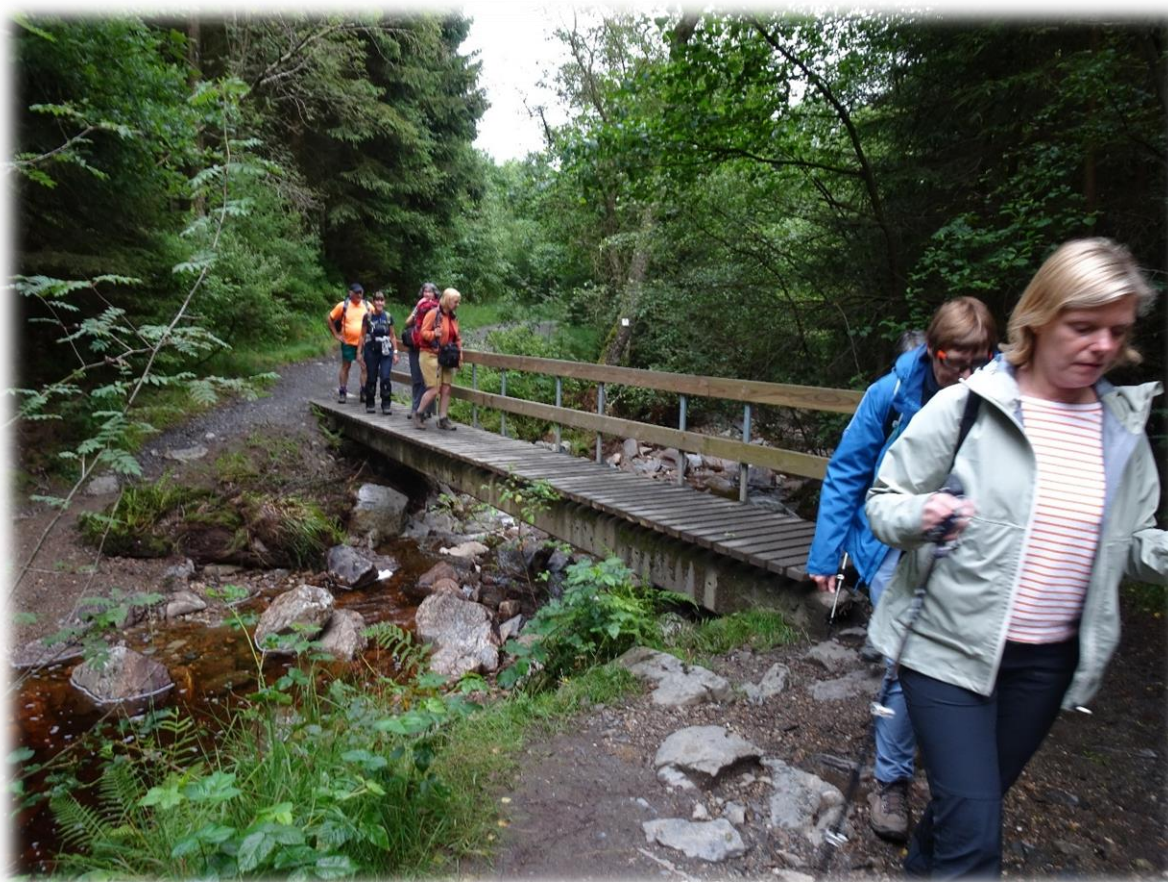
We steken een brug over en lopen naar de "Fagne de Setay", een van de lage moerassen van het hoogplateau. De venen doen denken aan een biotoop in de bergen met de wolfsbosbes, de