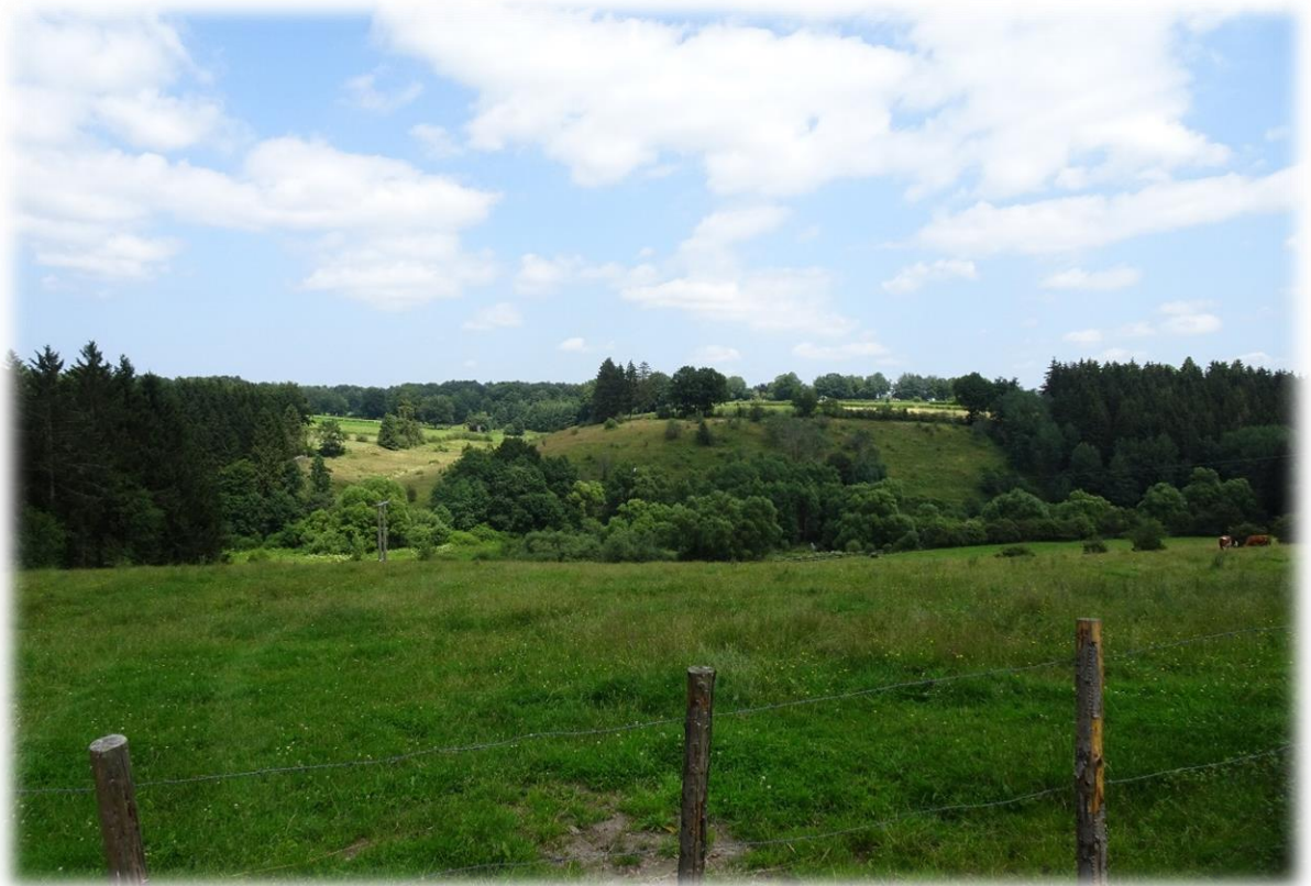
Enkele weken terug werd deze streek zwaar getroffen door noodweer. Aan de oevers van de Wirtzbach kan je nog goed zien dat de rivier buiten zijn oevers is getreden.