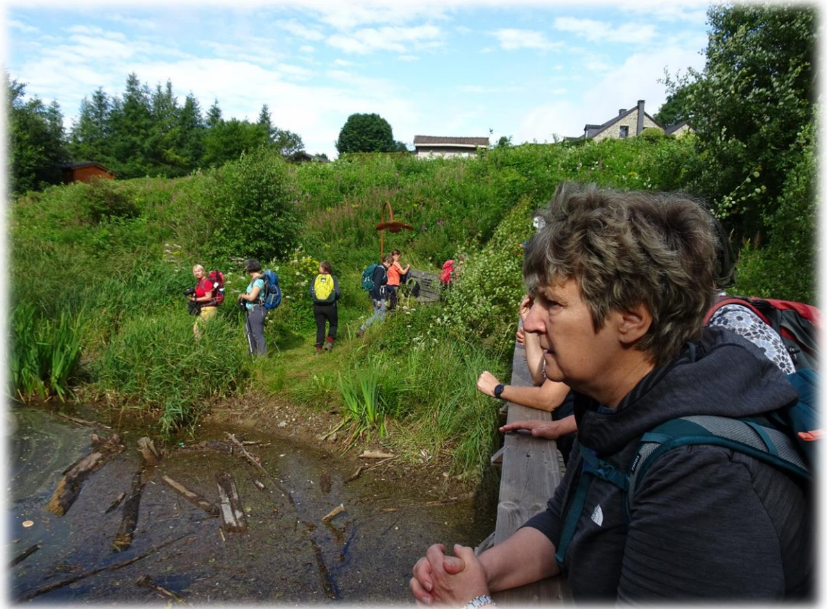
Robertville was een van de weinigen die reeds enkele dagen voor het noodweer losbrak het meer gedeeltelijk en geleidelijk liet leeglopen. Vermoedelijk heeft dit in de buurt wateroverlast weten te voorkomen.